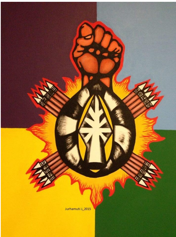
Imagen 4. Representación de k'urhikuaeri (deidad del fuego y la guerra) en la bandera p'urhépecha (Ariel Pañeda y Jurhamuti, 2015)

La fogata, el fogón centro de las cocinas en Cherán. Parhankua, parhangua, parhauakpekua elemento histórico culturalmente significativo ha sido la institución del dialogo (antes y después de la escolarización), generalmente se ubica en el centro del hogar p'urhépecha (tres piedras que sostienen al fuego) a pesar de la llegada estufas, hornos, microondas, la televisión y el i-box en Cherán se acostumbra seguir haciendo fogata, al “hacer lumbre” es posible escuchar el lenguaje del fuego, “el fuego habla en muchos tonos” afirma Don Evaristo, x'urhuki (medico tradicional) hablante del p'urhépecha, es uno de los pocos señores mayores que usa comúnmente su lengua en el barrio más tradicional: parhikutin o “parís” reducido así a lo castellanizado.