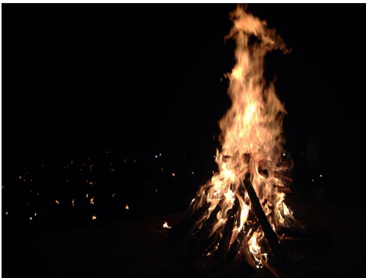
Imagen 5. La parhankua en Kurhikuaeri k'uinchekua Cheranio 2001 (Ceremonia de renovación del fuego en Cherán) (Jurhamuti, 2001).

En abril de 2011 la parhankua salió de lo privado a lo comunitario (180 fogatas aproximadamente), como en casa “en la fogata hablan todos y principalmente las mujeres” ellas mantienen “el fuego encendido” en ese espacio se reúnen los vecinos “parientes y no parientes” aquellas personas, que aun separados por un muro de concreto “ni se saludaban o ni se conocían”.