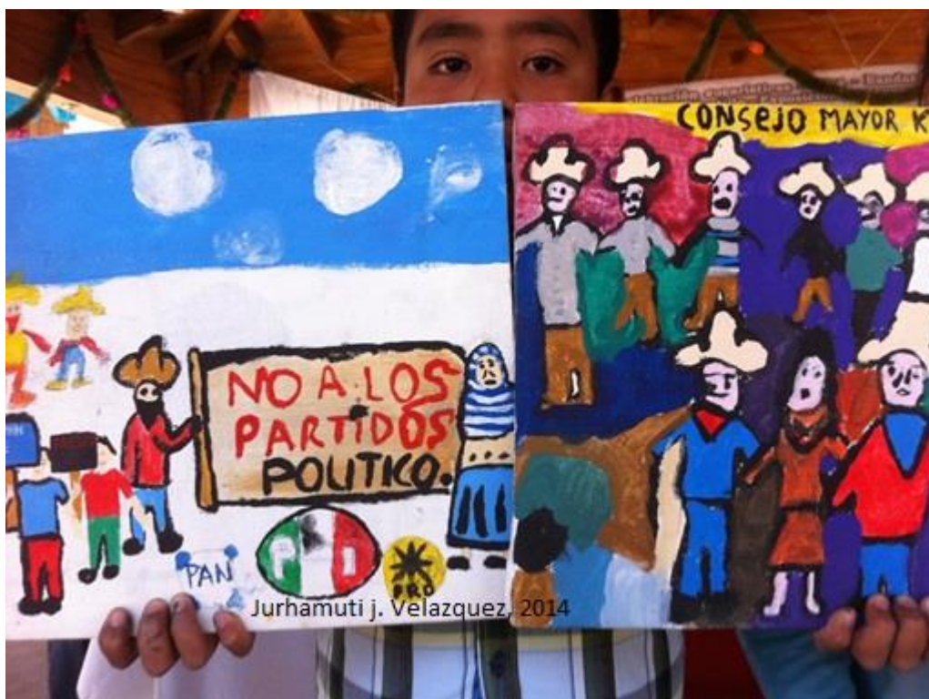
Imagen 2. Obras de Santiago, memoria colectiva de los niños (Jurhamuti, 2014).

Las primeras semanas después del levantamiento, la comunidad se organizó y nombró una Coordinación general de carácter provisional, existía la comisión de prensa, la comisión de víveres, la comisión política y una comisión de vigilancia desde ese momento, la gente que participó en el movimiento decidió implementar sus propios cuerpos de seguridad, desconocer a la policía municipal y posteriormente plantear un primer K'eri Jánaskaticha Concejo Mayor de Gobierno (2012-2015) ratificado, bajo el sistema de usos y costumbres indígenas y en base a un resolutive del Tribunal Electoral del Poder Judicial de la Federación promovido por la comisión política de la comunidad y la participación del equipo jurídico del Dr. Orlando Aragón Andrade.